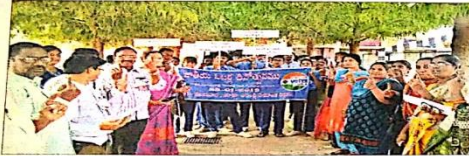
ఎస్ఎస్ఎం ఆధ్వర్యంలో ఓటర్స్ డే క్యాంపెన్ ప్రారంభిస్తున్న పాఠశాల యాజమాన్యం