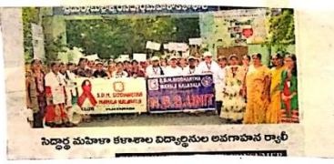
సిద్ధార్థ మహిళా కళాశాల విద్యార్థుల అవగాహన ర్యాలీ