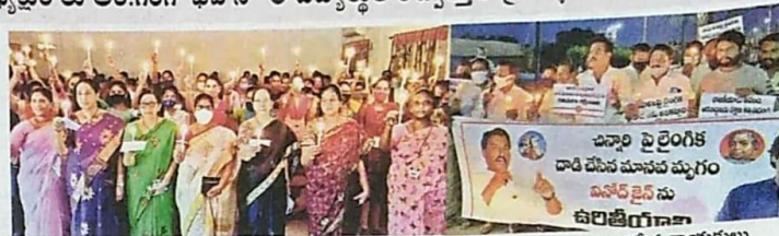
సిద్ధార్థ కళాశాల విద్యార్థినులు, అధ్యాపకుల కొవ్వొత్తుల ప్రదర్శన, నిరసన తెలుపుతున్న జనసేన నాయకులు

అ కారణంగా శనివారం రి వీధి, రాఘవరెడ్డి రోడ్డు ఏరియా, సైకం వారి వీధి సరఫరా నిలిపి వేస్తున్నట్లు